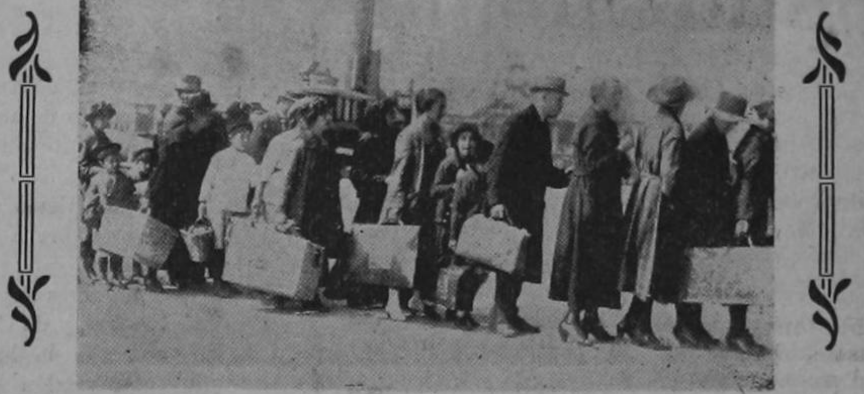
¡ADMITÍDOS!.—Esta fotografía, tomada en el puerlo de Nueva York, representa a un grupo de inmigrantes europeos penetrando en territorio americano, después de sufrir angustiosos y dilatados exámenes.