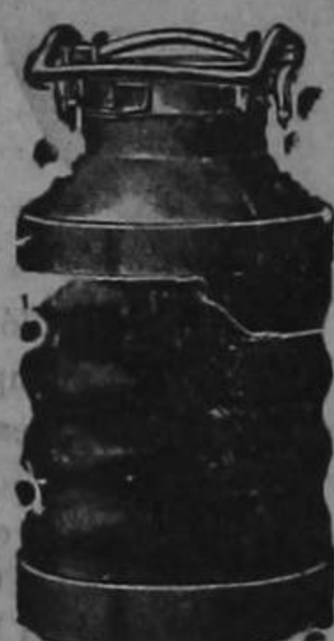
Almacenes al por mayor