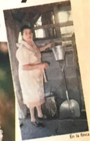
En la finca