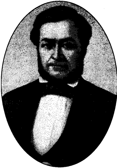
JUAN RAFAEL MORA PORRAS