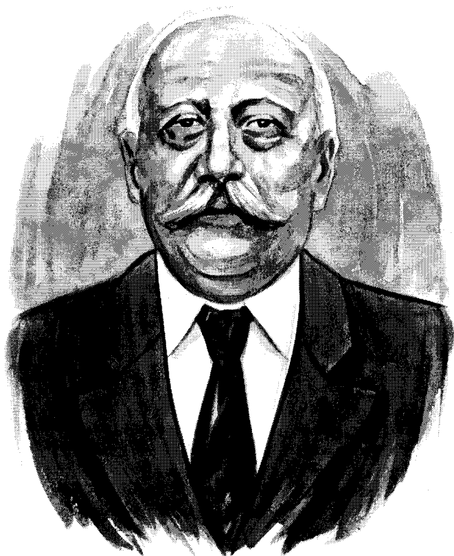
CARLOS GAGINI (1865-1925)