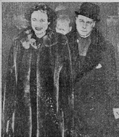
Los duques de Windsor abandonan la capital de Francia rumbo a la afamada Canes y la misma villa donde la duquesa —entonces Wally Simpson— pasó los días de su separación del abdicado monarca.

CINCO GRANADAS NACIONALISTAS CAUSARON VICTIMAS EN MADRID ESTA MAÑANA