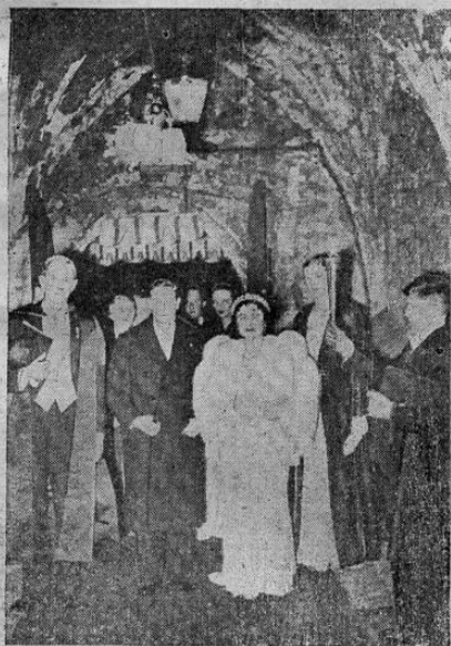
Los reyes de Inglaterra al llegar al afamado "Westminster School" de Londres, para atender a un juego tradicional.