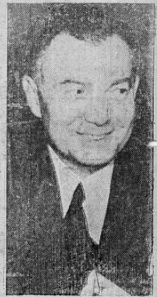
Robert H. Jackson ha dedicado tales censuras a los hombres de negocios de los Estados Unidos, que el mismo Congreso ha condenado sus manifestaciones. A juzgar por la fotografía, a él no lo preocupa mucho el asunto.