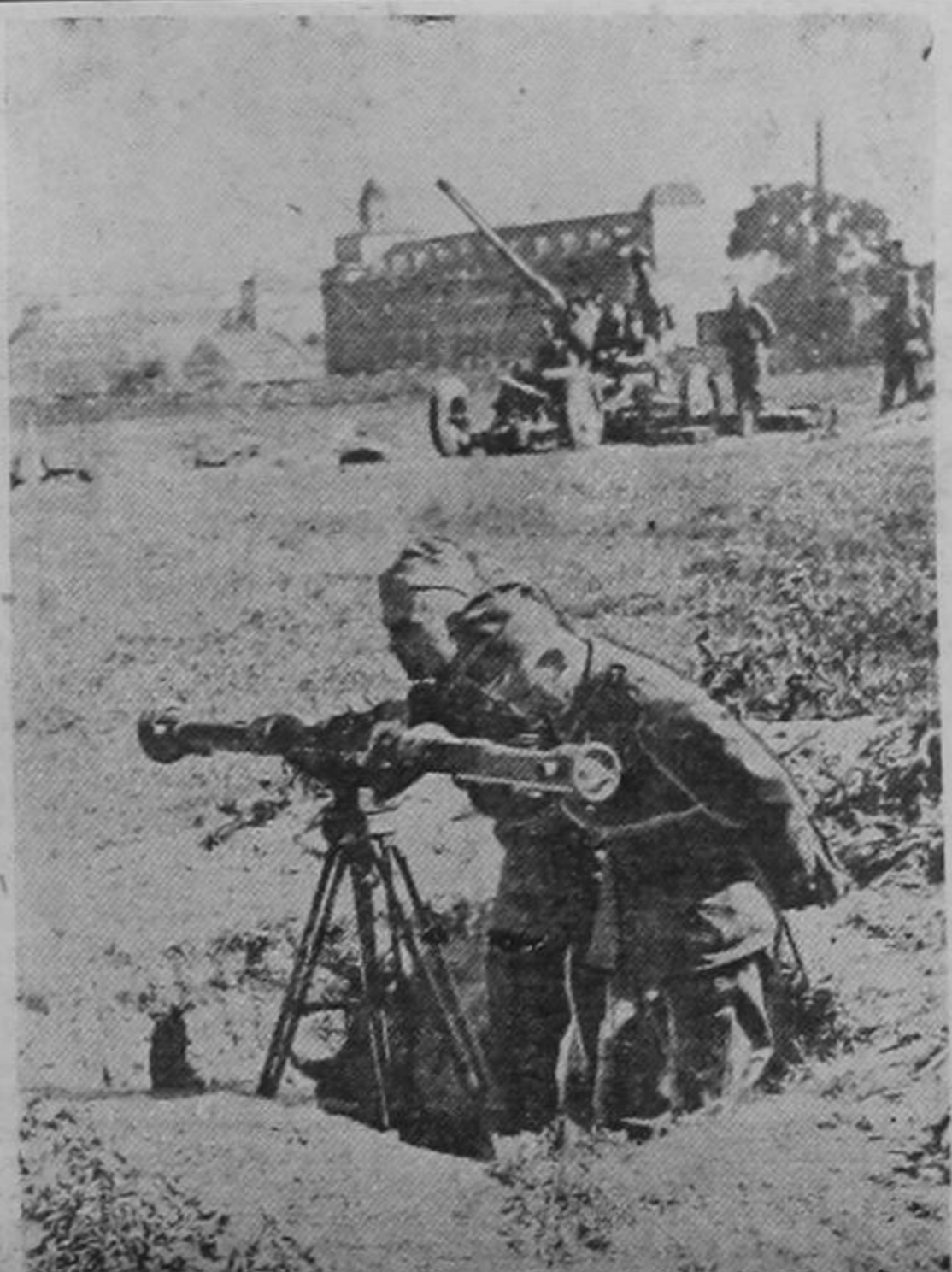
TROPAS ALEMANAS DE OBSERVACION EN ACCION

MOSCU, 17. — El diario IZVESTIA dice que Gran Bretaña y Francia no pueden establecer un bloqueo efectivo contra Alemania ya que ésta continuará recibiendo lo que necesita de Italia y Rusia. En un artículo firmado por Ivanoff, uno de los principales hombres de ciencia soviéticos, se da a entender que Rusia está preparada para dar a Alemania una importante ayuda económica, agregando que Italia, como país neutral, puede importar artículos que el Reich necesita y que en el reciente