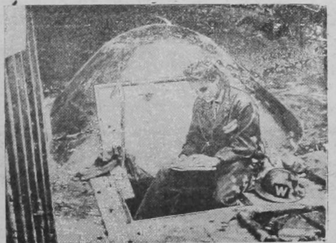
LAS MUJERES TAMBIEN INTERVIENEN EN LA GUERRA

BERLIN, 17.— Los diarios de hoy dedican su primera página casi enteramente a los informes y comentarios sobre los ataques alemanes a la flota británica, dando una descripción detallada de los barcos que han sido hundidos o dañados por los submarinos o los aviones germánicos. —(PASA a la Pág. OCHO)