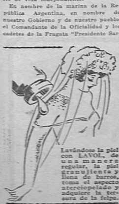
Lavándose la piel con LAVOL, de una manera sencilla y rápida, se libera de la granujería y la grasa de la cara, se desinfecta y adquiere la tersura de la seda.

Honrándolo a él, honramos a aquellos hombres que echaron los fundamentos de esta gran república, honra de la democracia americana; honrándolo a él honramos las virtudes fundamentales de este pueblo en el día de la celebración de su 107 aniversario de vida independiente. En nombre de la marina de la República Argentina, en nombre de nuestro Gobierno y de nuestro pueblo, el Comandante de la Oficialidad y los cadetes de la Fragata "Presidente Sar-