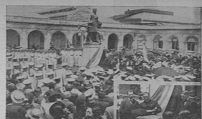
GRUPO-GRANDE. —En el momento en que la Banda de a bordo ejecutaba el Himno Nacional, los cadetes y soldados de marina de "La Sarmiento" presentan las armas ante la estatua de don Juan Mora Fernández.