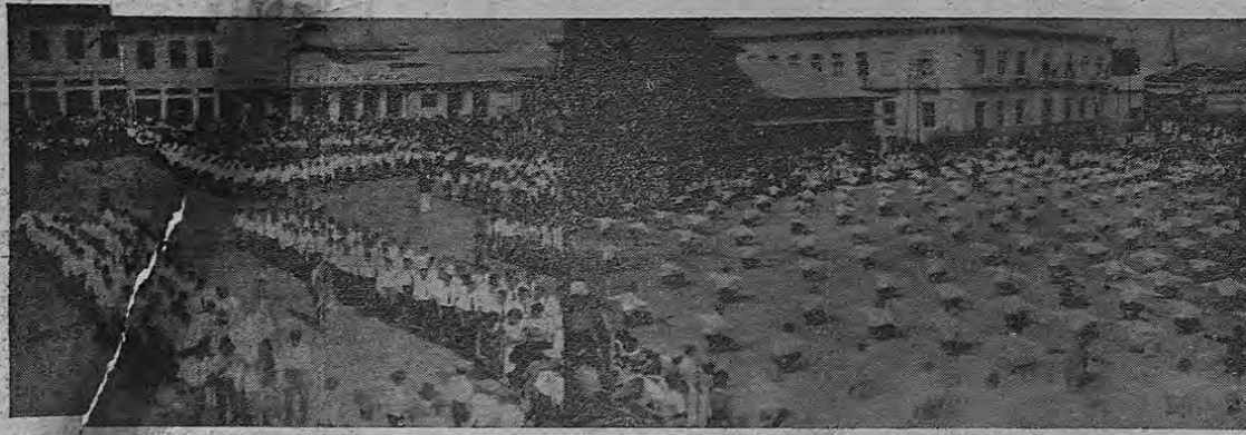
En estas vistas pueden verse varios aspectos de los ejercicios físicos que lucidamente llevaron a cabo los estudiantes.