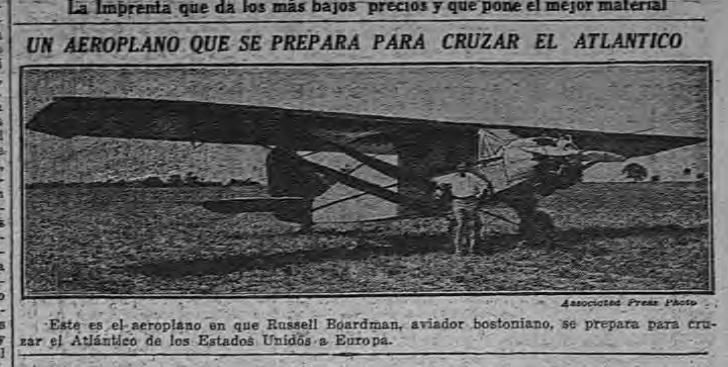
Este es el aeroplano en que Russell Boardman, aviador bostoniense, se prepara para cruzar el Atlántico de los Estados Unidos a Europa.