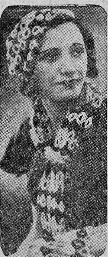
Bello modelo de otoño, que puede usarse con traje de sport o con el conjunto de sombrero, bufanda y guantes en combinación que puede ser de diversos colores.

—Esta noche se verificará el gran baile en el Tenis Club de Limón por el cual existe gran entusiasmo. Gran número de personas de esta ciudad, de Cartago y