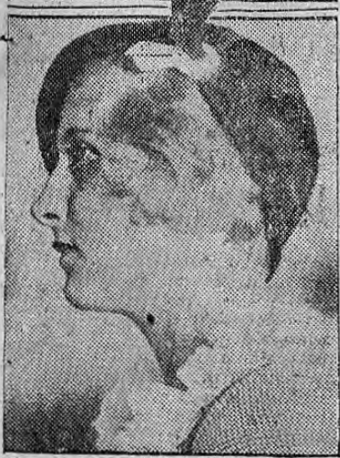
Aquí tenemos dos elegantes modelos de sombreros. El de arriba, llamado de concha de tortuga, es de terciopelo negro y lleva un velo. El de abajo es de una combinación de muselina de seda, adornada con piedras del Rhin.