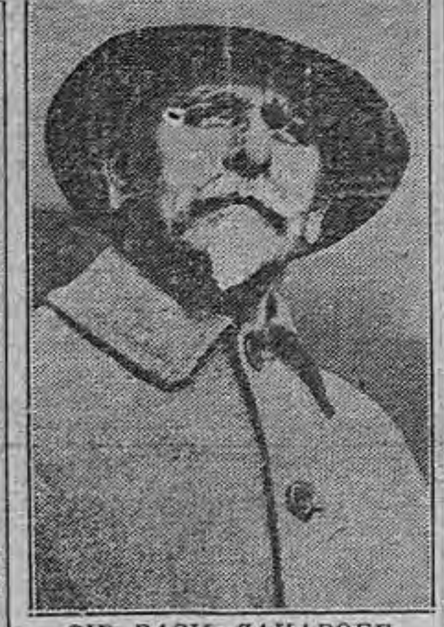
SIR BASIL ZAHAROFF

ZAHAROFF, AGENTE SECRETO, DUQUE ESPAÑOL, AMIGO DE REYES Y PRESIDENTES Y POSEEDOR DE UN TITULO INGLÉS