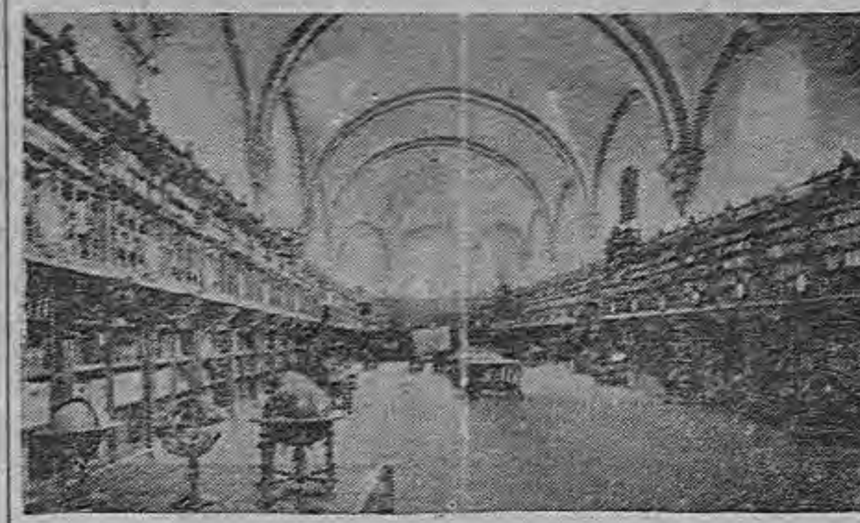
LA GLORIOSA UNIVERSIDAD DE SALAMANCA FACHADA DE LA UNIVERSIDAD

La célebre Biblioteca de la Universidad de Salamanca guarda más de 100.000 volúmenes, con 333 incunables y numerosos manuscritos de enorme interés.