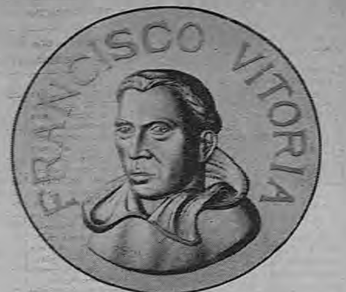
FRANCISCO DE VITORIA Fundador del Derecho Internacional y del Derecho de Gentes