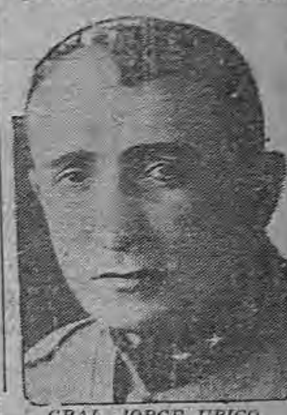
GRAL. JORGE UBICO

Se trataba de un plan comunista que tenía por fin provocar una revolución