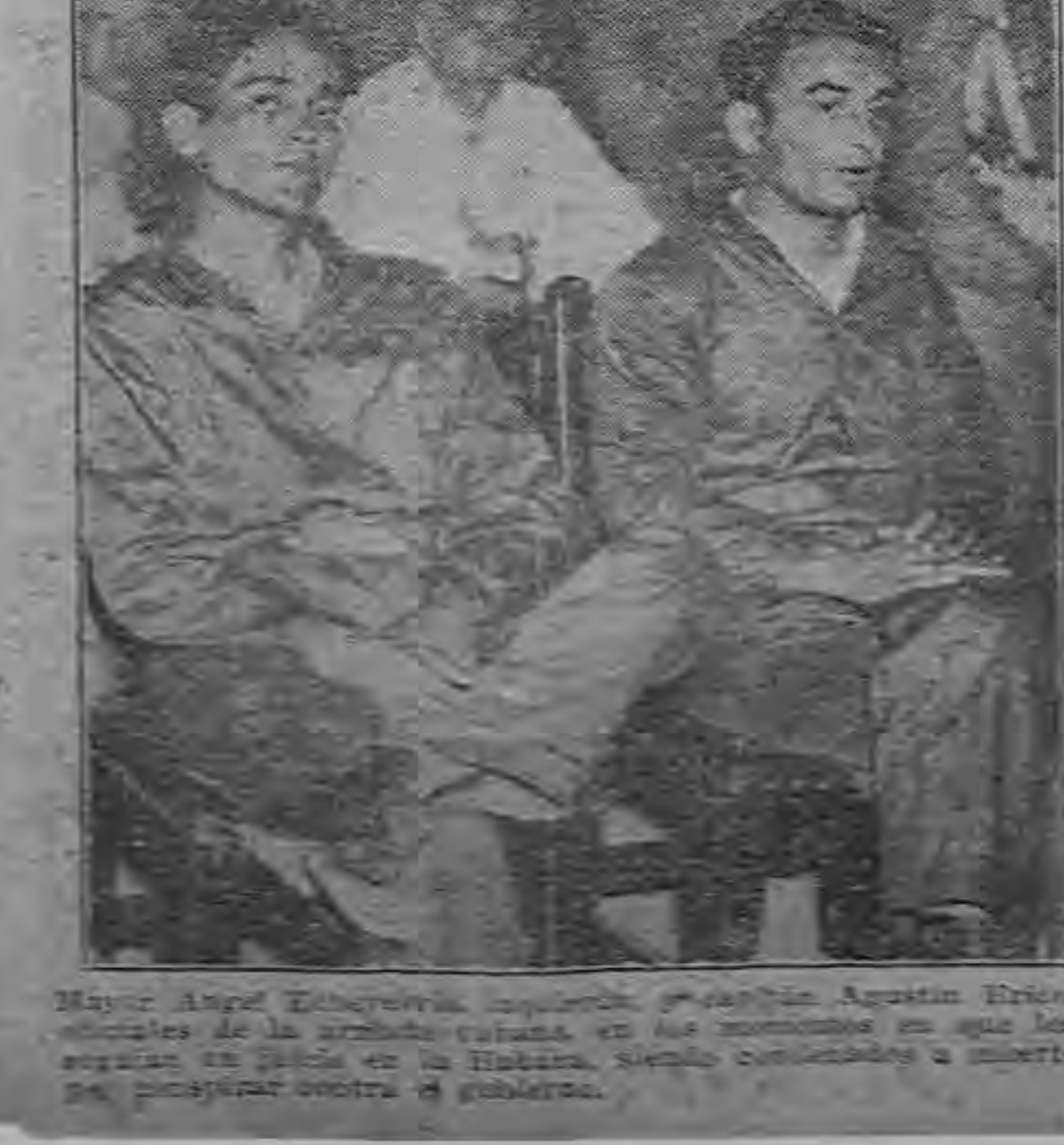
Mayor Ángel Escobar y otros oficiales cubanos condenados a muerte por participar contra el gobierno.