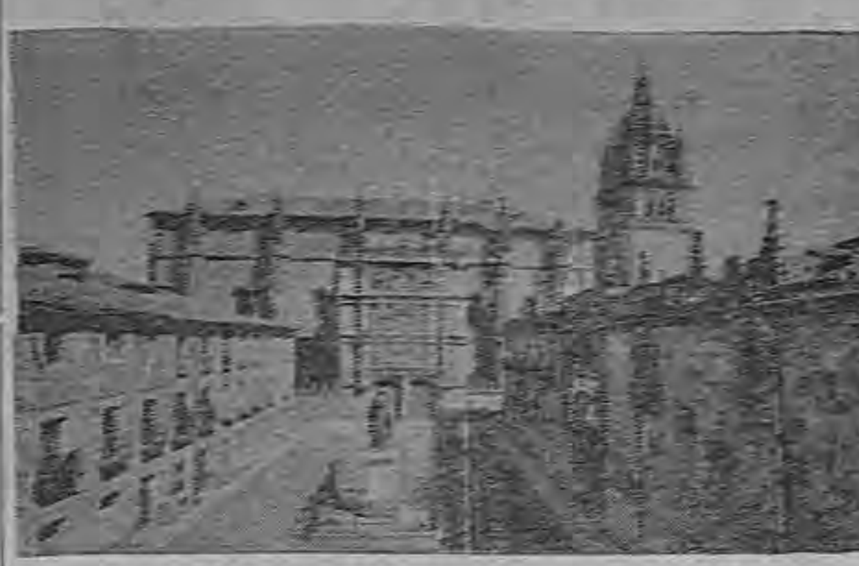
LA GLORIOSA UNIVERSIDAD DE SALAMANCA LA BIBLIOTECA

La célebre Biblioteca de la Universidad de Salamanca guarda más de 100.000 volúmenes, con 333 incunables y numerosos manuscritos de enorme interés.