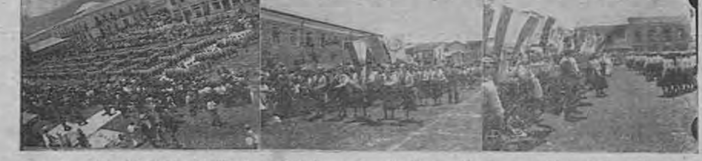
Tres fotografías del desfile del Colegio de Señoritas, y los ejercicios verificados en la Plaza de la Artillería el domingo en la mañana y los cuales merecieron cálidos elogios por parte de todo el público