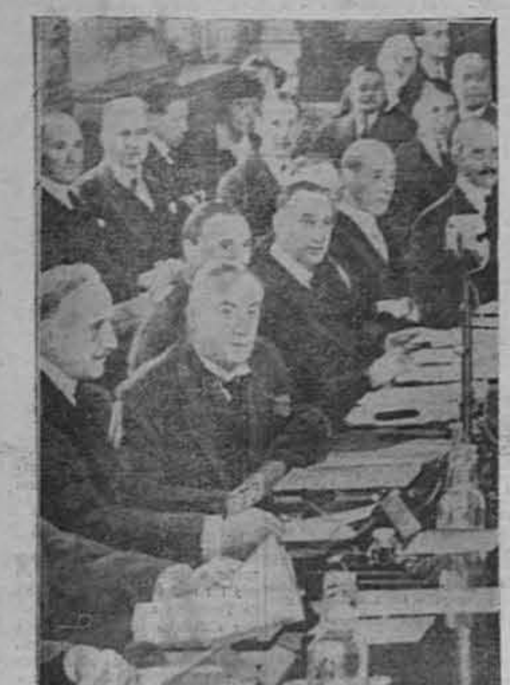
Durante las conferencias de Londres, recogió esta notable foto, el momento en que el premier Baldwin, (segundo de izquierda a derecha), escucha atentamente las declaraciones del japonés, demandando la igualdad naval.