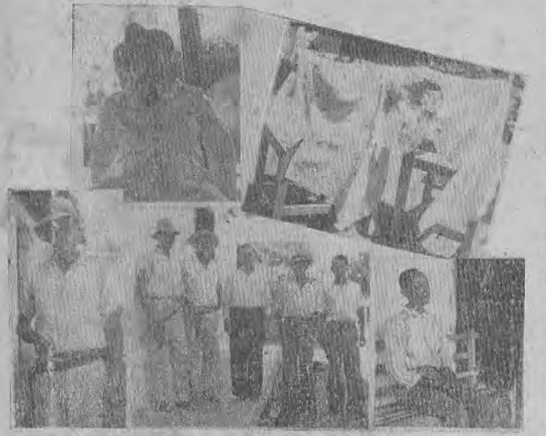
El grabado recoge a los principales protagonistas de la captura del famoso prófugo, la cual se practicó después de un dramático tiroteo entre el perseguido y un guarda fiscal