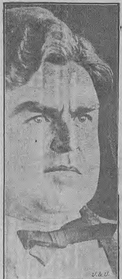
Hubo 2.333 huelgas en Estados Unidos en los siete últimos meses, no viembre y diciembre del año pasado y hasta mayo inclusive del actual. Si la proporción se mantiene como en lo que va corrido de este año este país registrará 4.672 huelgas en 1937 año que pasará así a la historia como el más turbulento de los conflictos sociales de Estados Unidos. Ni siquiera la avalancha de huelgas de 1917, cuando la falta de brazos lanzó a los trabajadores a luchar por grandes salarios, igualará a este año de la "nueva prosperidad". La historia de Estados Unidos, desde que comenzó la sindicalización obrera en 1880, muestra una matemática coincidencia entre los periodos de