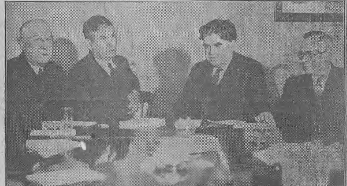
John E. Lewis, el jefe-dirigente de la Federación del Trabajo de los Estados Unidos y una de las figuras de destacada actuación en aquella nación