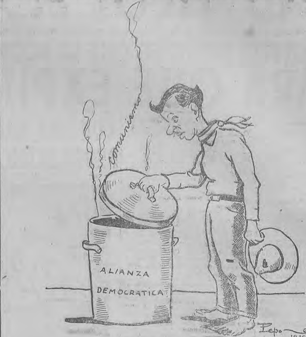
Por algo no me gustaba elolorcito