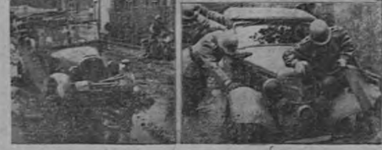
El lodo en Rusia ha sido un eficaz auxiliar de las tropas de defensa frente al avance de las unidades motorizadas y de artillería de gran calibre, de alemanes, rumanos y finlandeses. Como se puede apreciar en las distintas escenas del grabado que representan esa titánica lucha contra "el general lodo".

Inglaterra y los Estados Unidos envían a Rusia la gran mayoría de sus equipos, dejando en las islas únicamente lo estrictamente necesario para su defensa