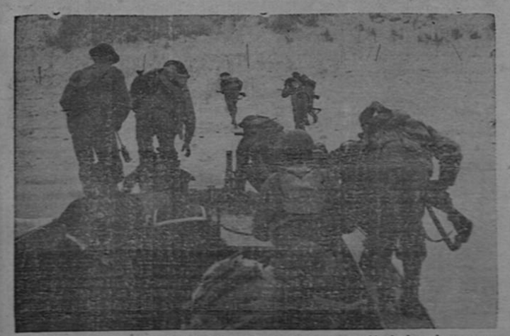
Las ya famosas tropas norteamericanas de asalto, durante una operación de desembarco en un lugar no identificado del frente europeo. Estas fuerzas, llamadas "Rangers", participaron con los comandos británicos y unidades canadienses en el victorioso ataque a las posiciones alemanas de Dieppe, en la costa francesa. Miles de estos soldados están esperando ansiosos el momento de lanzarse a una general ofensiva contra las hordas hitlerianas.

Setiembre 14, 1942. Con ocasión del 121 aniversario de la Independencia Nacional del Deportivo de Costa Rica (VEA Col. 5.—Pág. DOCE)