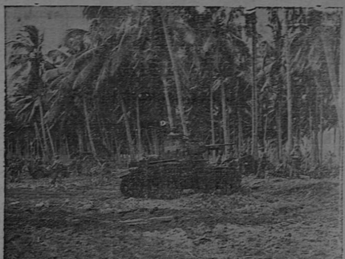
La vanguardia de las fuerzas norteamericanas que conquistaron el dominio de las islas Salomón, hacen alto en las selvas que rodean la importantísima base de Guadalcanal, antes de iniciar la acción decisiva. La brillante operación fue precedida por un violentísimo bombardeo naval que sorprendió completamente a los japoneses.

SIN NOVEDAD LONDRES. 14.—(PA).—Los misterios de aviación y de seguridad interior dieron a publicidad un comunicado conjunto en el cual hacen saber que en las horas de la oscuridad no se registraron hechos dignos de mención. (VEA Col. 4.—Pág. DOCE)