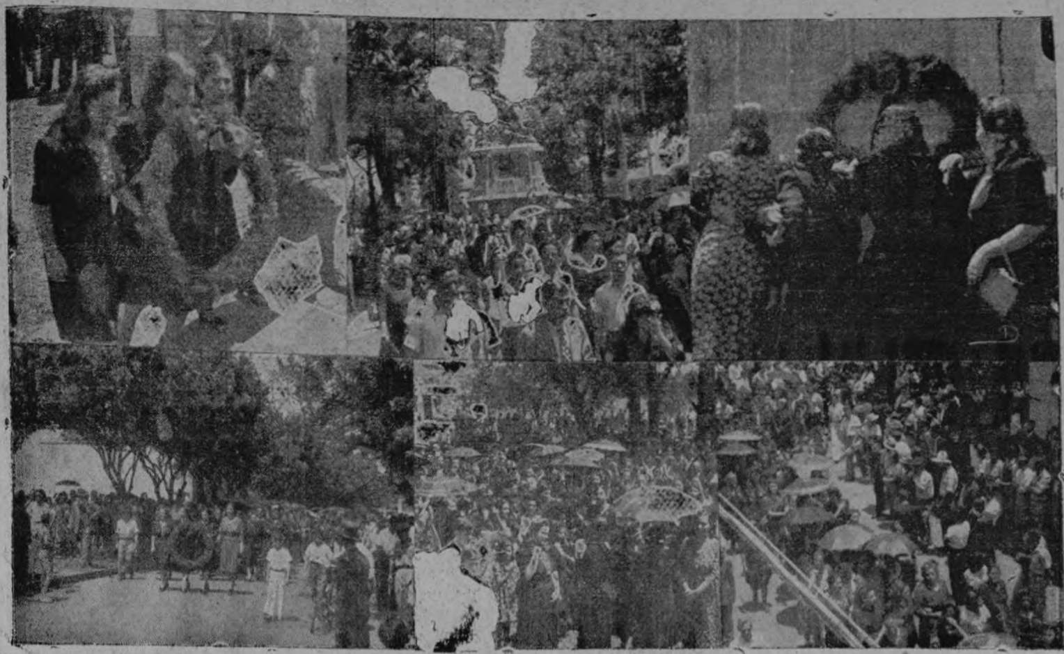
Silenciosas y enlutadas desfilaron las damas y señoritas por las calles capitalinas, bajo la mirada rencorosa de los cristianísimos camaradas.

Gritaron las brigadas de choque cuando el Director de la Policía les prohibió seguir tras las damas que vestidas de luto desfilaron por la Avenida Central, después de depositar una corona en el Monumento Nacional