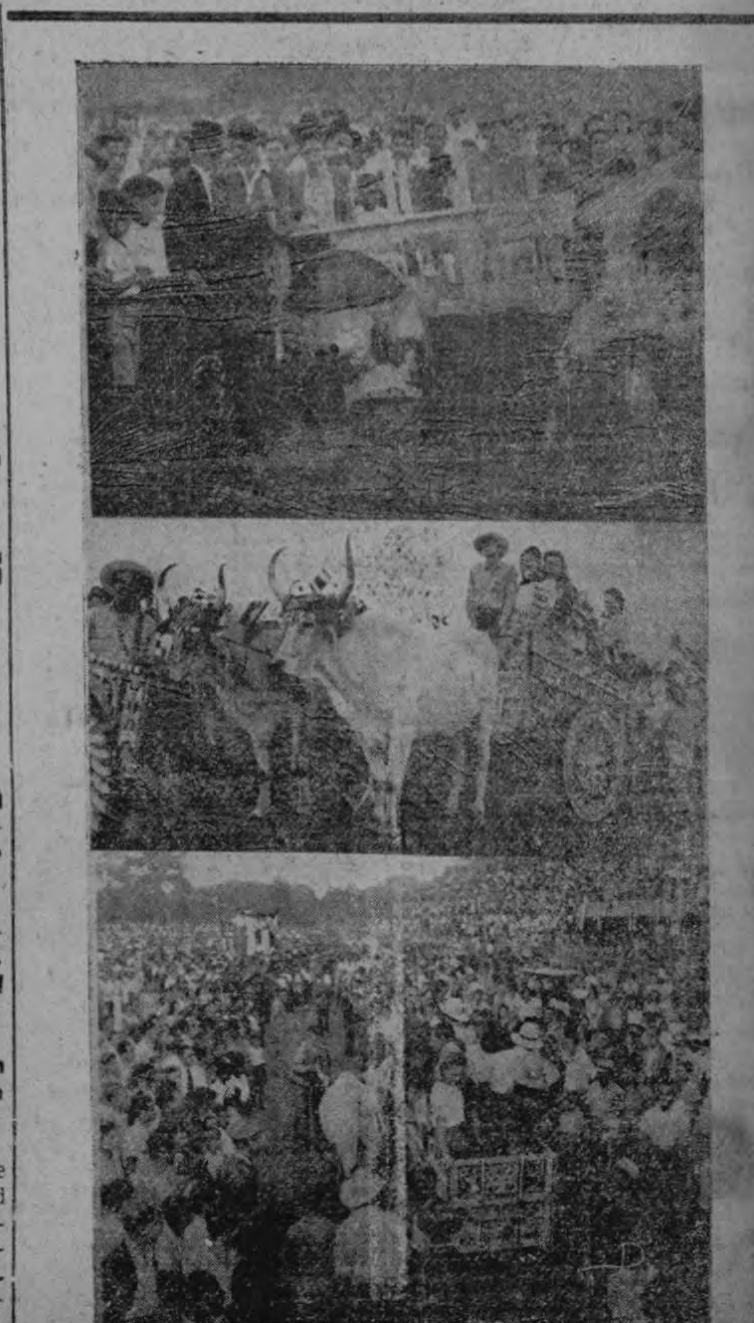
Estupendas gráficas del magnífico concurso de carretas, promovido por el Departamento de Coordinación.