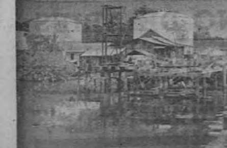
Fuente Cieneguita: — Clavando los postes que soporta obra maestra. En el centro el ingeniero Arguedas; al extremo derecho, el escarpado, Chaves. El martinetes de una locomotora fue construido en el taller de Obras Públicas.

FUENTE CIENEGUITA: — Este puente en construcción tendrá, una vez terminado, un ancho de vía de 22 pies con dos aceras voladas de 4 pies de ancho cada una, el largo total es de 153 pies, se considera que será el puente de hormigón más largo y ancho de la república.