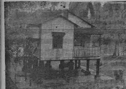
EDIFICIO PARA EL RESGUARDO DE PORTETE

Con beneplácito podemos informar que son varias las construcciones y reformas que se están efectuando en este puerto, gracias a las buenas intervenciones de elementos de este puerto que en verdad desean de corazón el resurgimiento de esta ciudad y de lugares estrechamente ligados. Hay que constatar el decidido apoyo que a todas estas gestas ha dado el señor ministro de Fomento y la cooperación que ha reconocido el señor gobernador y municipalidad.