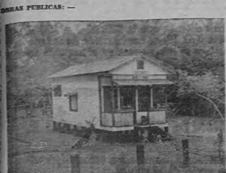
EDIFICIO PARA EL RESGUARDO DE MOIN

Con beneplácito podemos informar que son varias las construcciones y reformas que se están efectuando en este puerto, gracias a las buenas intervenciones de elementos de este puerto que en verdad desean de corazón el resurgimiento de esta ciudad y de lugares estrechamente ligados. Hay que constatar el decidido apoyo que a todas estas gestas ha dado el señor ministro de Fomento y la cooperación que ha reconocido el señor gobernador y municipalidad.