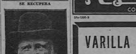
SE RECUPERA Muestra esta foto a Bernard Shaw, el famoso escritor y dramaturgo inglés...