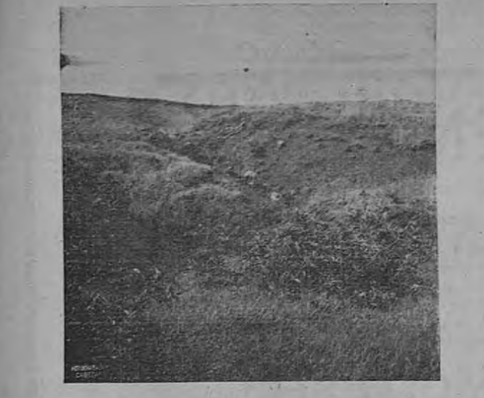
"Toda carne es heno" dijo alguna persona, con sobrada razón, porque los pastos se convierten en carne: pero que pastos pueden producirse en este terreno, donde la mejor tierra se está yendo, al fondo del mar.