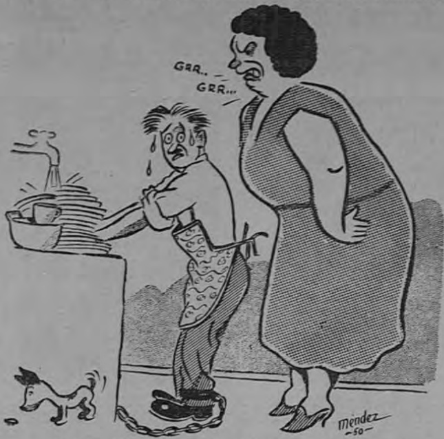
—Quién dijo "Independencia"??