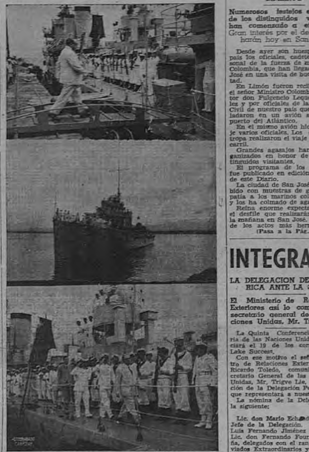
El grabado recoge tres momentos interesantes de la llegada de los marineros colombianos a Limón: el señor Ministro Lequerica Vélez en momentos en que hacía su paso de tierra firme costarricense a posesión de su patria en el barco de la armada colombiana, llegada a nuestro puerto. Una de las unidades de guerra de Colombia. Los marineros presentando armas al ser visitados por el señor Ministro colombiano en Costa Rica.

LES FUE TRIBUTADO UN CALUROSO BIENVENIMIENTO