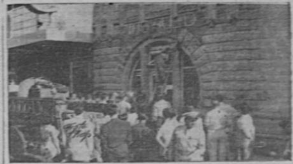
PRINCIPIO DE INCENDIO.—Un principio de incendio estuvo a punto de causar un desastre de grandes proporciones en la Tienda de las hermanas Aued, en la Avenida Central. Gracias al llamado de una empleada de la Mueblería Urgelín, llegaron los bomberos, actuando a tiempo de evitar una conflagración. En la fotografía se ve a un bombero introduciéndose por una linterna.—(Foto Bolaños).

Como la cuota total era de . . . 13.500 y como se vendieron menos, se abrió oportunamente una nueva licitación para colocar el resto de la disponibilidad.