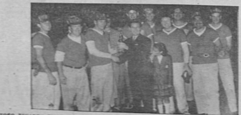
TOMO ESCASU ENTRE TROFEO. — El Director de Deportes hace entrega de un trofeo a los jugadores del equipo de Fútbol de la Embajada Americana, el único equipo que pudo derrotar a la selección de Nicaragua. El partido fue apretado y se celebró en el Estadio Nacional.