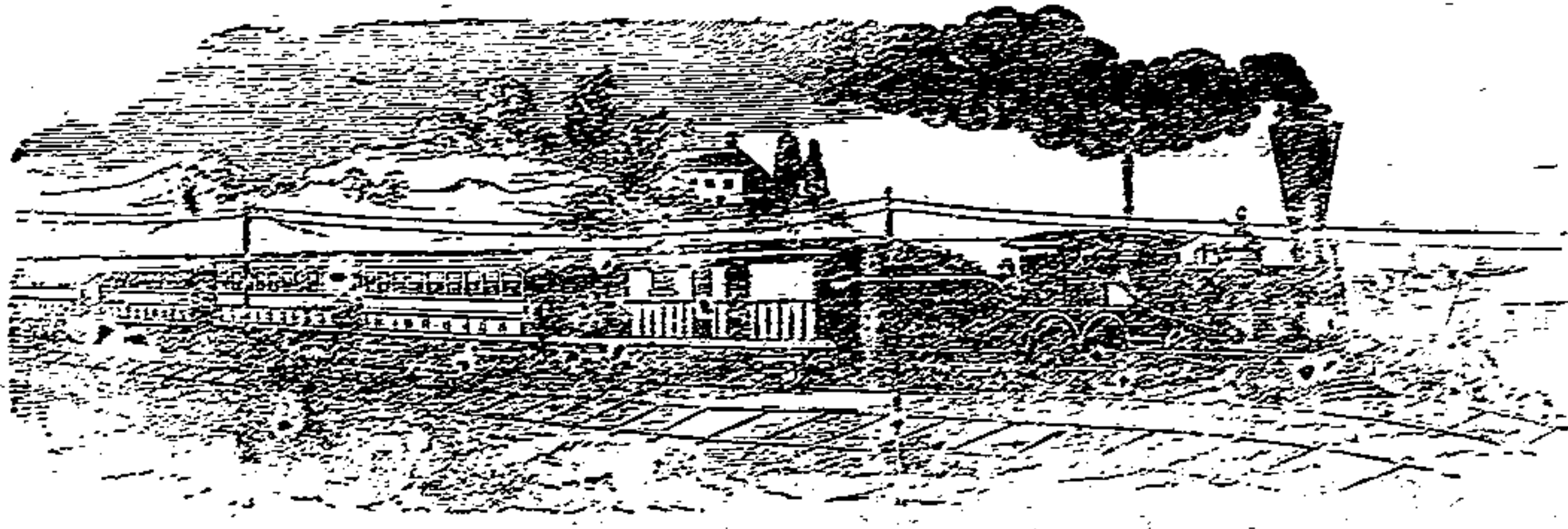
DIARIO DE LA TARDE, INDEPENDIENTE, NOTICIOSO Y DE VARIEDADES.