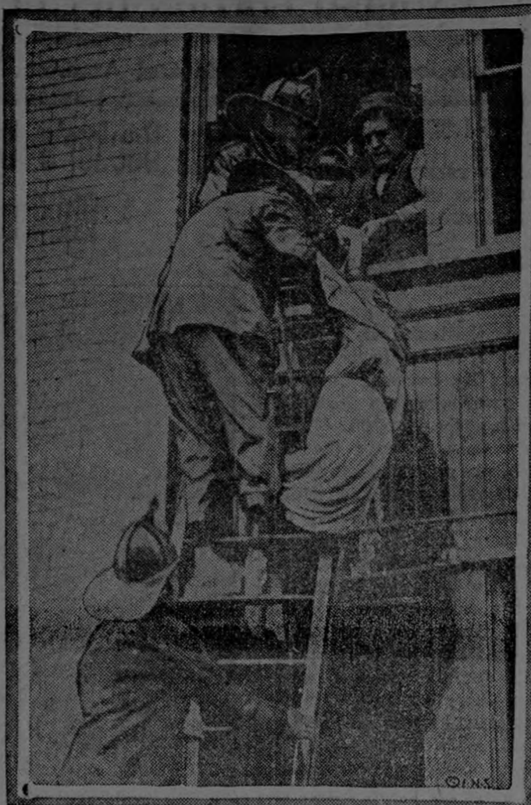
This cut shows a scene at the recent fire at the Union Paper Box Co. in Pittsburgh, Pa., in which fourteen persons were burned to death. The picture shows a fireman saving a girl's life through a fourth story window.