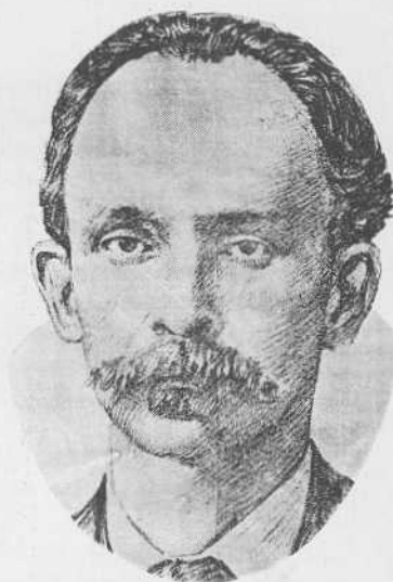
Doctor don José Martí