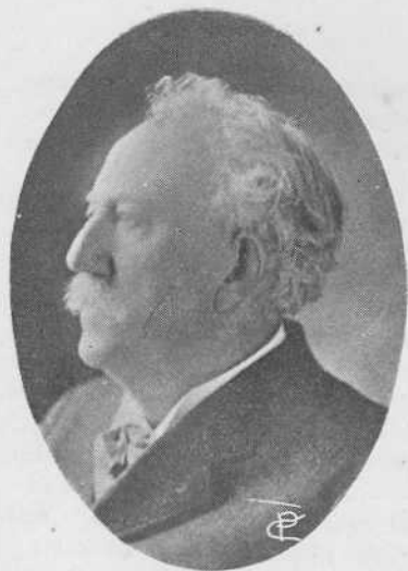
Profesor don David Starr Jordan