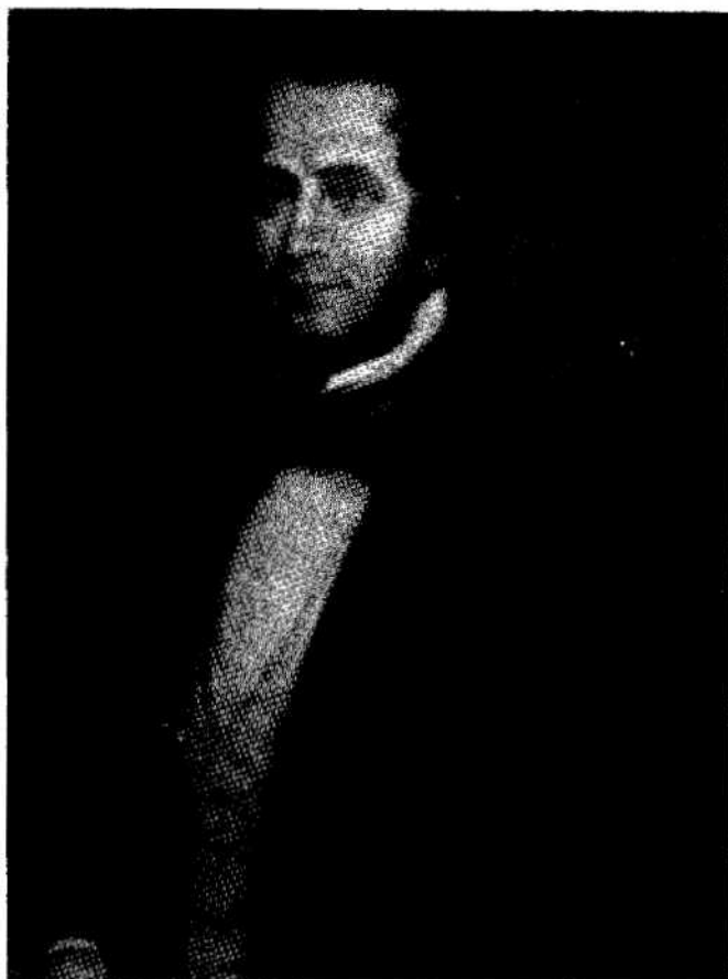
FELIPE MOLINA Primer Ministro Plenipotenciario de Costa Rica ante países europeos y Estados Unidos.