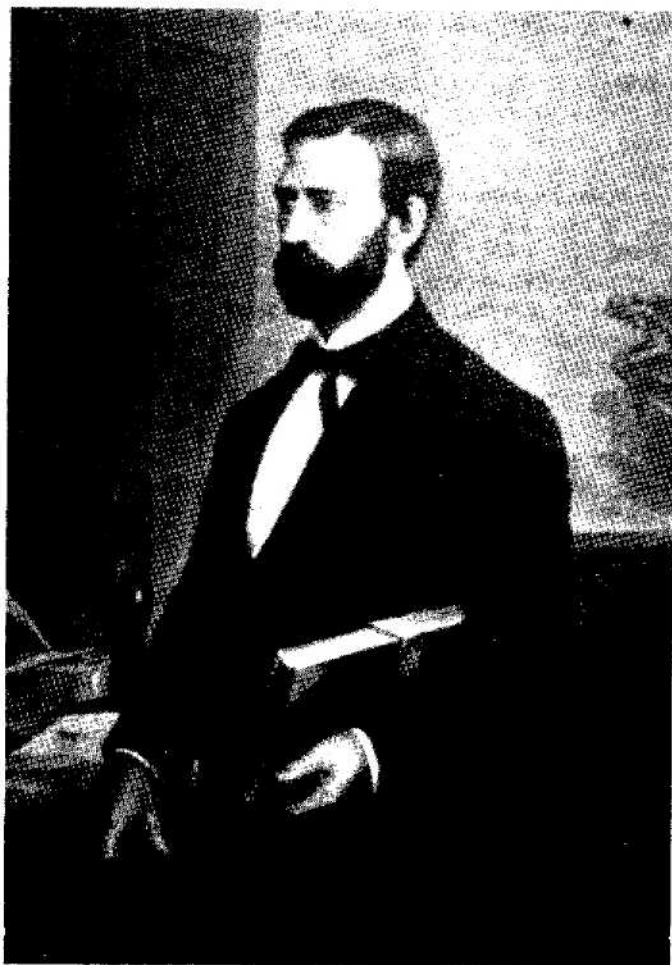
LUIS MOLINA Ministro de Costa Rica ante el gobierno de Estados Unidos