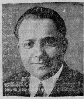
Sadi-Lecomte, aviador célebre