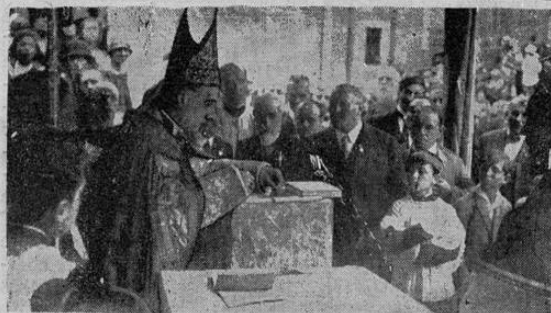
Francia, Monseñor Rolland-Cosselin, poniendo la primera piedra de una iglesia que va a ser erigida a Santa Genoveva, en Nanterre, su villa natal

Filadelfia, 2.—Los mineros de antracita pasaron el primer día de huelga como si fuese un día de fiesta en medio de las diversiones.