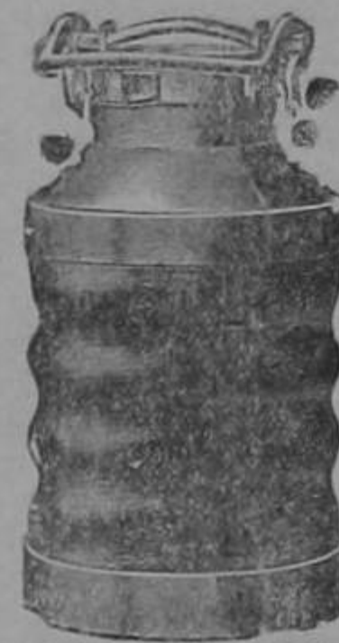
Pinturas Al bastin etc.

CATRES Americanos grandes y pequeños. Felpudos Mangueras alambradas.