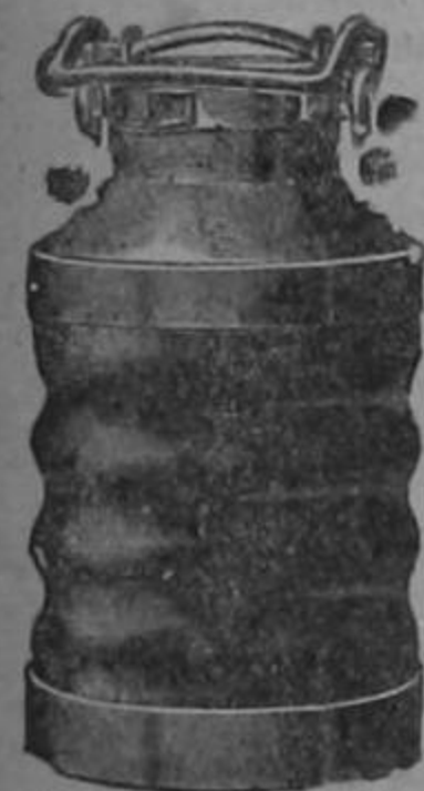
pinturas Alabastin etc.

CEMENTO "Alsen"; clavos, alambre de cerca, ara dos varios modelos, cocinas de hierro para leña, lavatorios, inodoros, tanque alto y bajo, de Sarchí sillas, etc