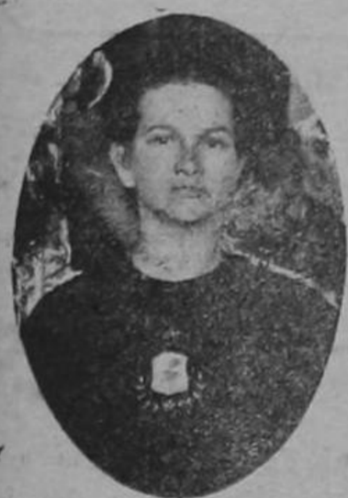
(Mullier timens Dominum ipsa laudabitur. La mujer que teme a Dios, esa será alabada. Prov. XXX. 30.)

gobierno de su casa desplegó siempre su actividad y supo dirigir con acierto maravilloso los menesteres de la familia, sin que su noble espíritu dejara su unión con Dios. Como la santa madre de San Gregorio Nacianceno, ella practicaba perfectamente los consejos contenidos en el libro de los Proverbios: hizo prosperar de tal manera sus negocios domésticos, que se habría podido decir que no se ocupaba de las cosas del cielo; y sin embargo, era tan piadosa que parecía extraña a todos los asuntos de la casa. Ninguna de estas dos obligaciones perjudicaba a la otra; por el contrario, parecía que se fortificaban y perfeccionaban recíprocamente.