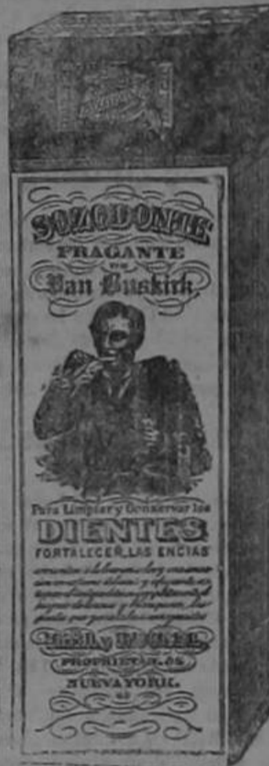
Esta es la figura exacta del paquete según se vende.

HALL & RUCKEL, 218 Washington St., New York, EE. UU. de A.