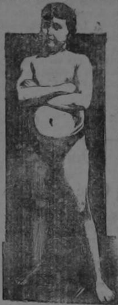
EDAD 11 AÑOS

La transformación maravillosa de un sér endebles y raquítico en un adolescente fuerte, robusto y sano, como lo demuestra su atlé- tica figura, fué obra realizada por la