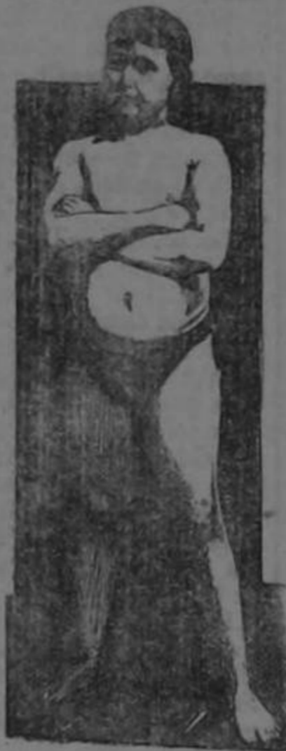
EDAD 11 AÑOS

La transformación maravillosa de un ser endeble y raquítico en un adolescente fuerte, robusto y sano, como lo demuestra su atlética figura, fué obra realizada por la