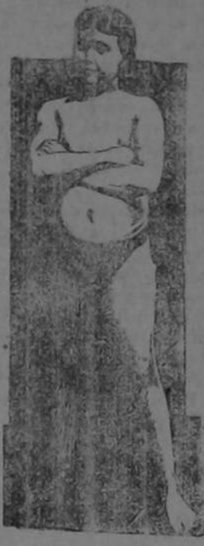
EDAD 11 AÑOS

La transformación maravillosa de un sér endeble y raquítico en un adolescente fuerte, robusto y sano, como lo demuestra su atlética figura, fué obra realizada por la