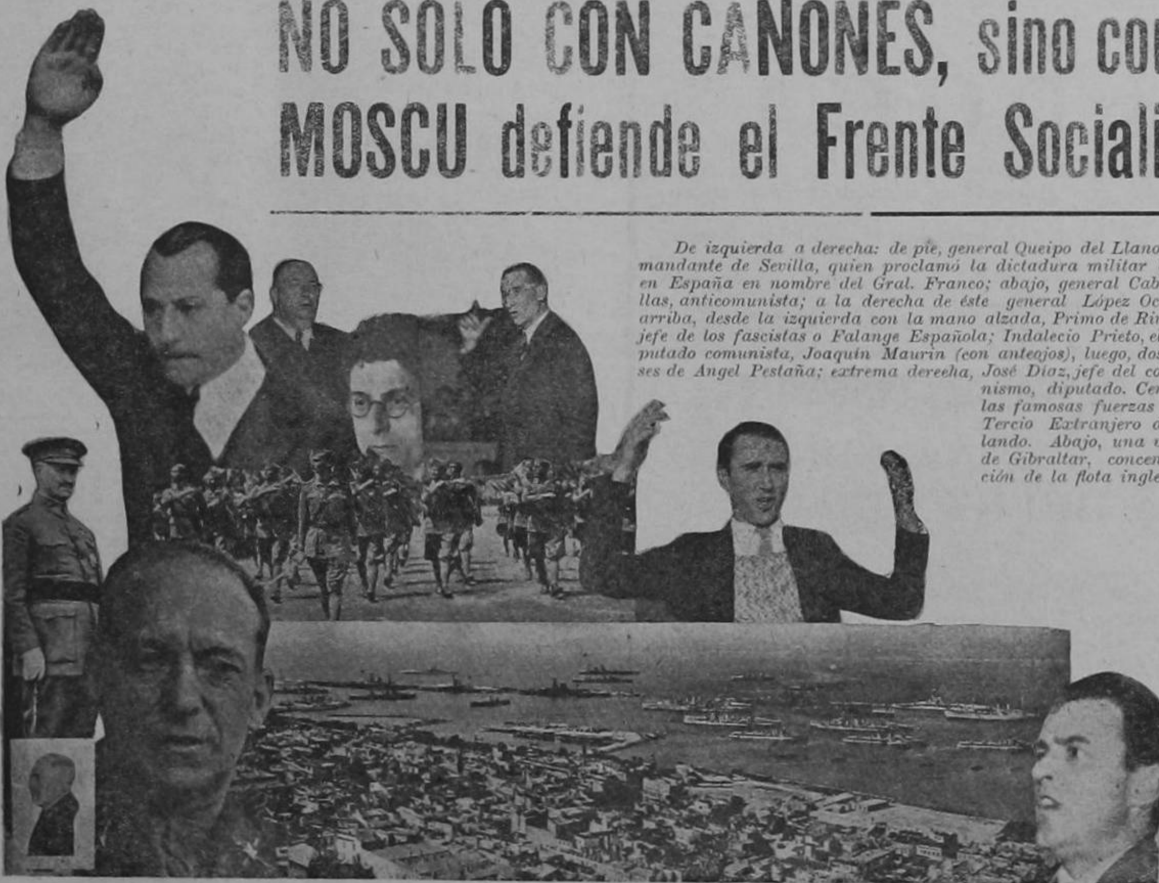
De izquierda a derecha: de pie, general Queipo del Llano, comandante de Sevilla, quien proclamó la dictadura militar ayer en España en nombre del Gral. Franco; abajo, general Cabanellas, anticomunista; a la derecha de éste general López Ochoa; arriba, desde la izquierda con la mano alzada, Primo de Rivera, jefe de los fascistas o Falange Española; Indalecio Prieto, el diputado comunista, Joaquín Maurín (con anteojos), luego, dos poses de Angel Pestaña; extrema derecha, José Díaz, jefe del comunismo, diputado. Centro: las famosas fuerzas del Tercio Extranjero desfilando. Abajo, una vista de Gibraltar, concentración de la flota inglesa.

BERLIN, 22.—En este momento se intercepta un discurso en español procedente de una de las más poderosas estaciones del Soviet con residencia en Moscú.