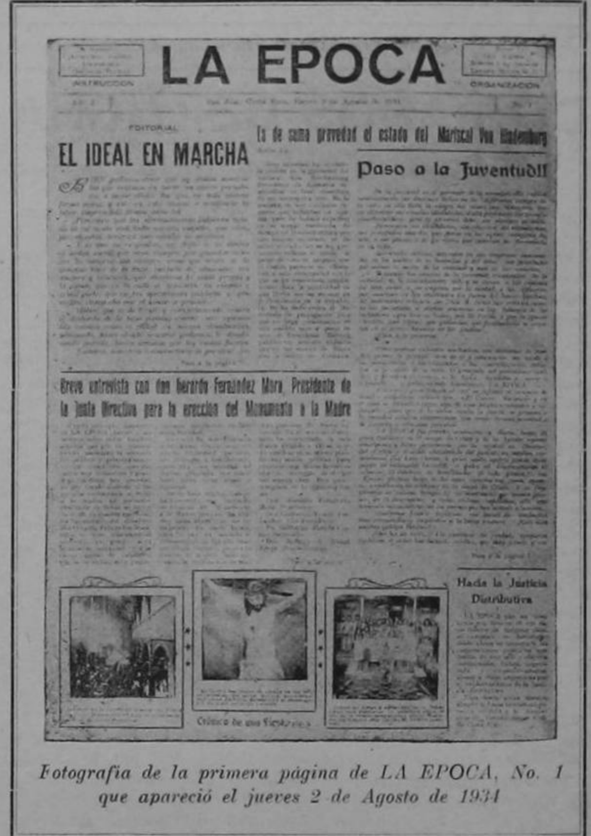
Fotografía de la primera página de LA EPOCA, No. 1 que apareció el jueves 2 de Agosto de 1934