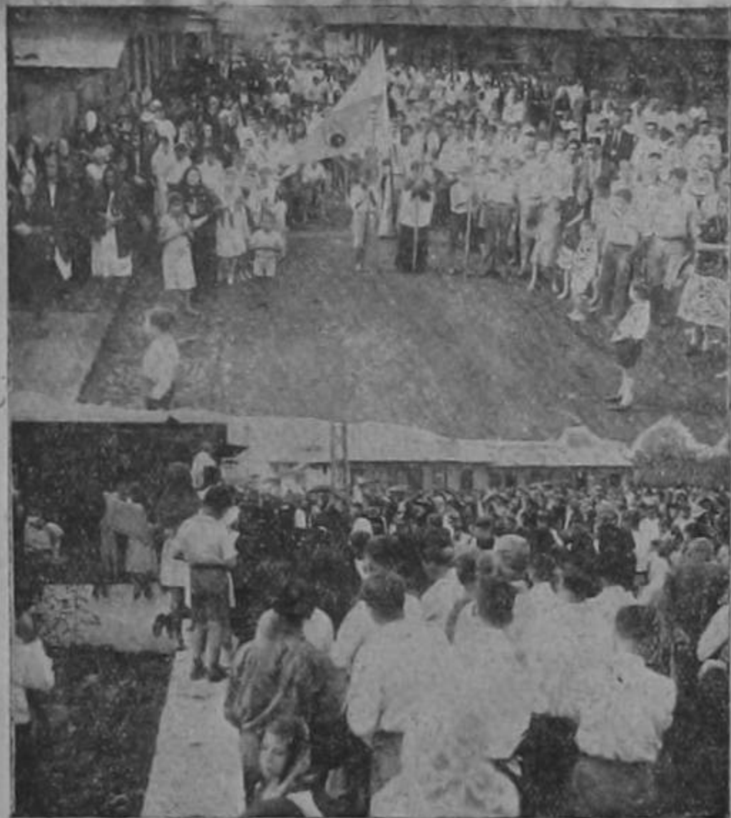
Diferentes aspectos de la manifestación religiosa del Domingo en Alajuela

Nuestro periódico, anunció a su debido tiempo, que en la ciudad de Alajuela se iba a celebrar una gran peregrinación, que saliendo de la propia Catedral debería recorrer el trayecto hasta el templo del Sagrado Corazón de Jesús.