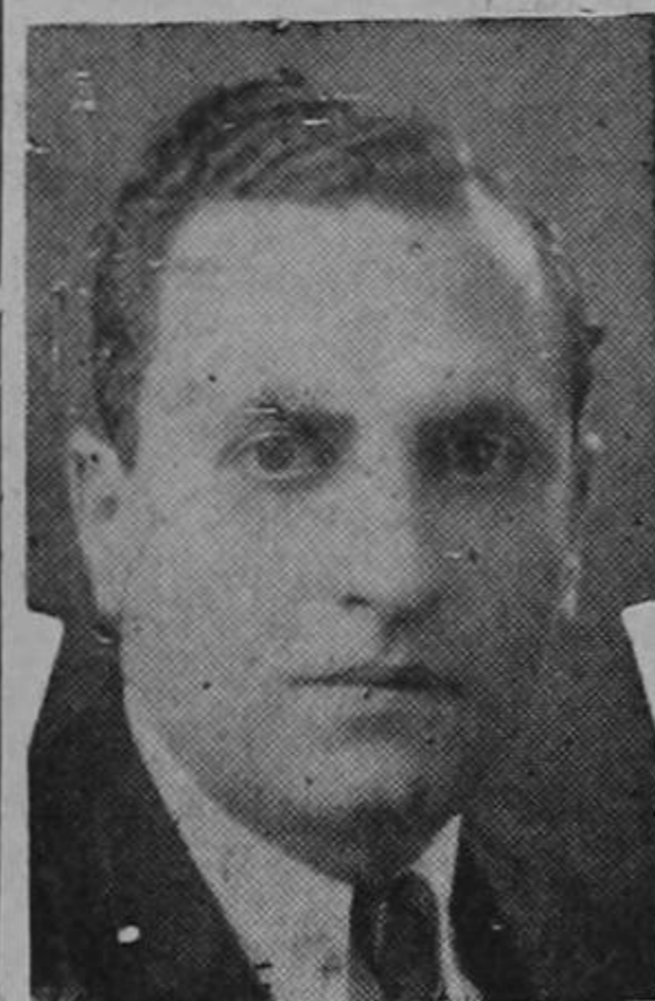
DR. DON RAFAEL ANGEL CALDERÓN GUARDIA Presidente electo de C. Rica