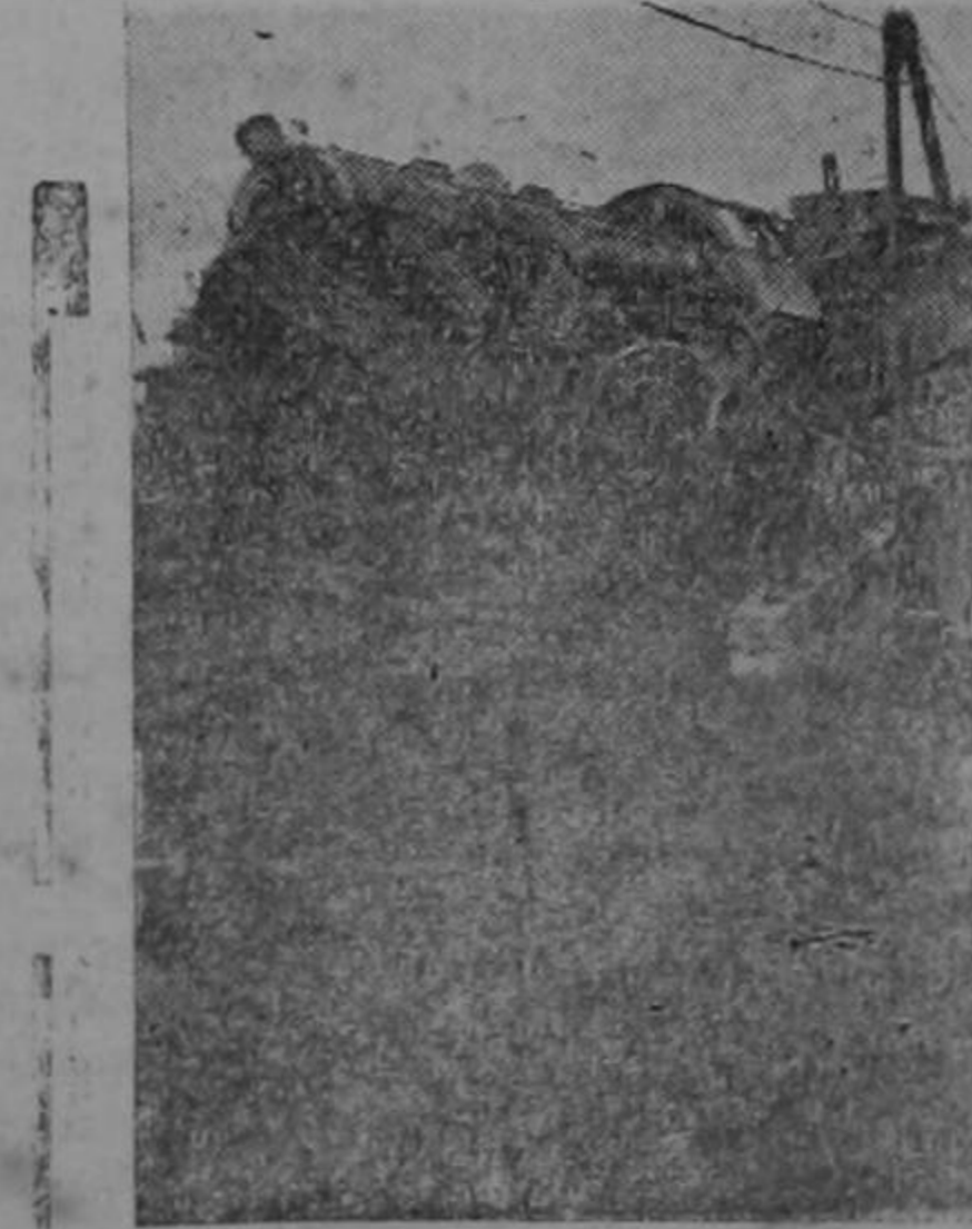
UNA LOCOMOTORA DESTRUIDA POR UNA GRANADA A LA ENTRADA DE UN TUNEL