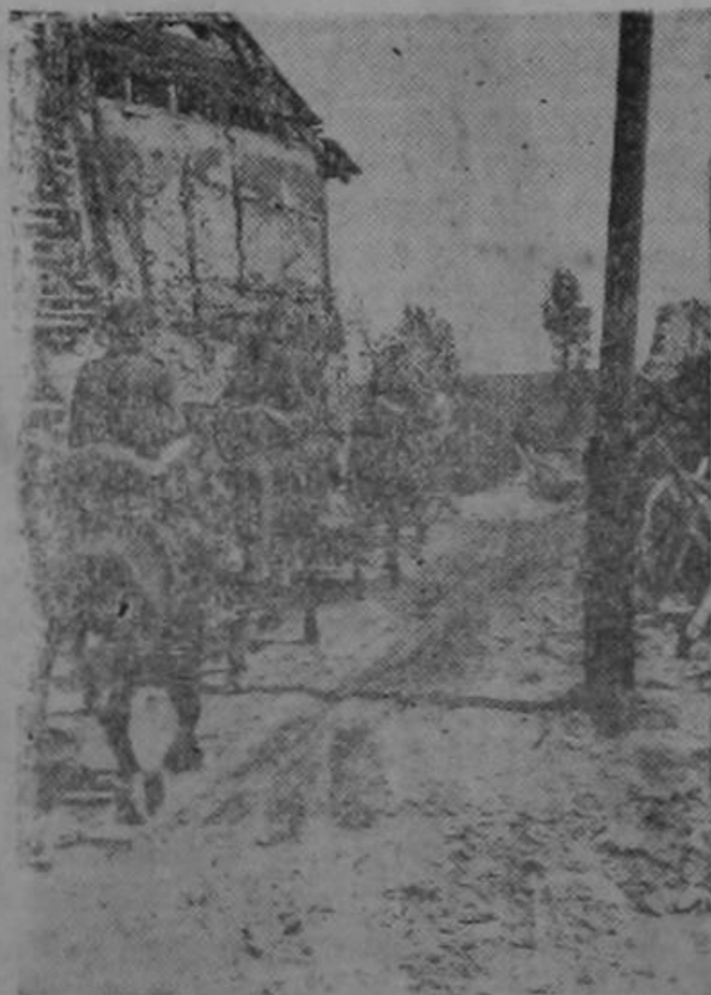
CABALLERIA ALEMANA DE PASO POR UNA POBLACION DENTRO DE LA ZONA DE FORTIFICACIONES DE LA LINEA MAGINOT