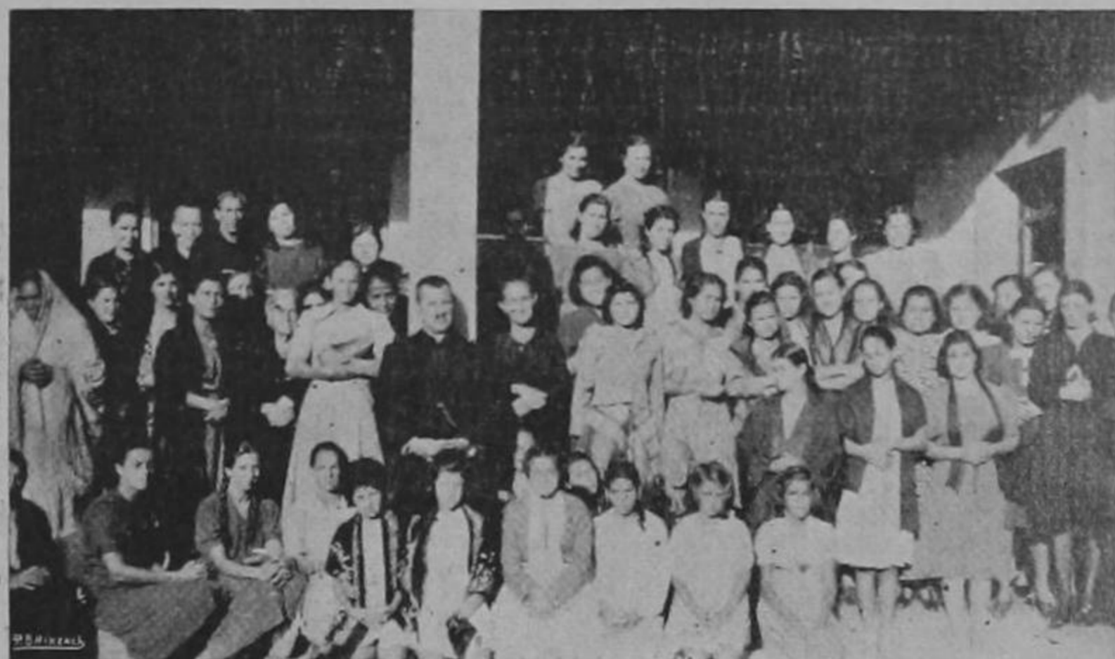
Atención de Hojita Parroquial