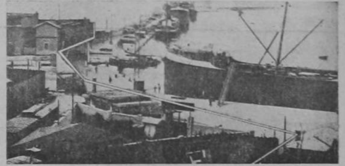
UNA PANORAMICA DE YUGOESLAVIA

La frontera italo-yugoeslava (línea blanca) divide Jusek, importante puerto del Adriático.