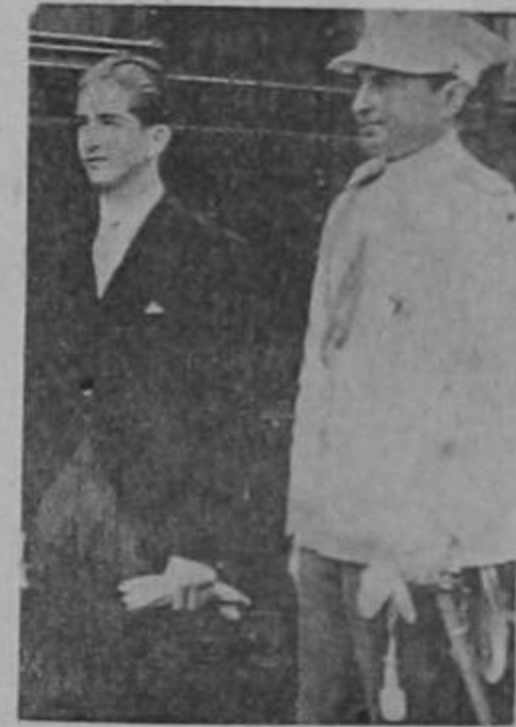
EL REY PEDRO II y el ex-Regente Pablo

La frontera italo-yugoeslava (línea blanca) divide Jusek, importante puerto del Adriático.