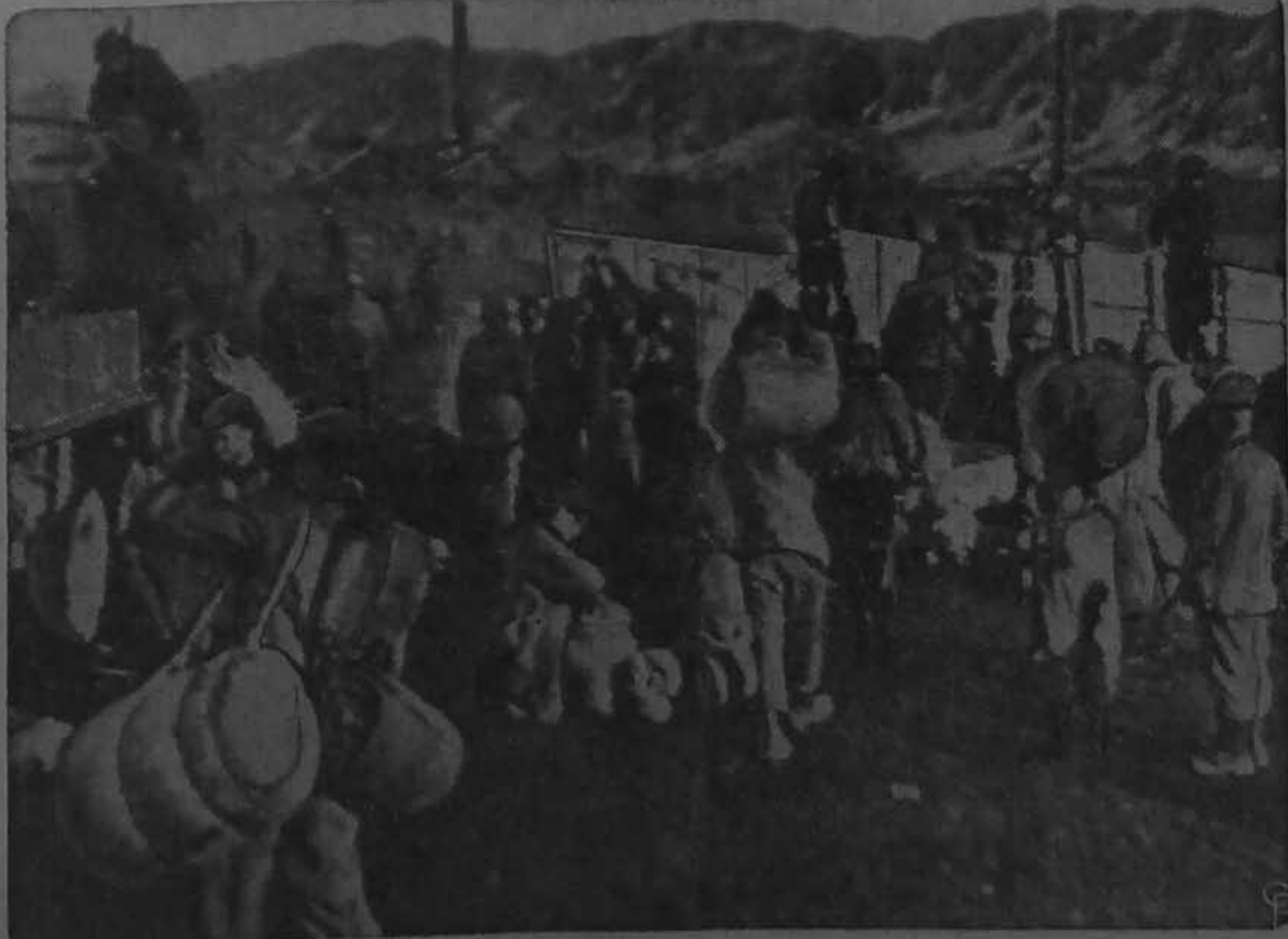
La cabeza de playa de Hungnam marca el fin de la sangrienta retirada de las tropas de las Naciones Unidas que escaparon de la trampa tendida por los comunistas chinos en el Noroeste de la Corea. Esas fuerzas aparecieron en los momentos de evacuar la cabeza de playa

El paro se produjo, con base en el hecho de que la declaratoria de legalidad de la huelga no esté firme, en vista del recurso de apelación interpuesto TEXTO EN LA PAGINA 31