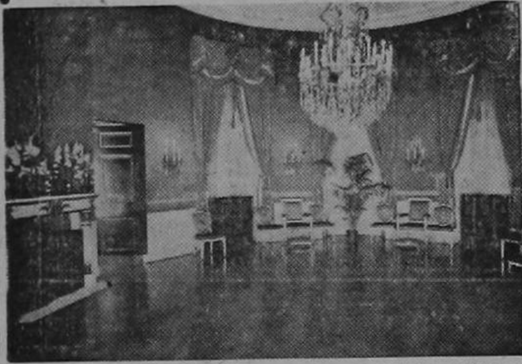
El Salón Azul de la Casa Blanca, en el que se festeja a visitantes distinguidos.

WASHINGTON. — La Casa Blanca, residencia oficial del Presidente de los Estados Unidos y de su familia, ha vuelto a abrir sus puertas al público, que habían estado cerradas desde antes del ataque a Pearl Harbor.