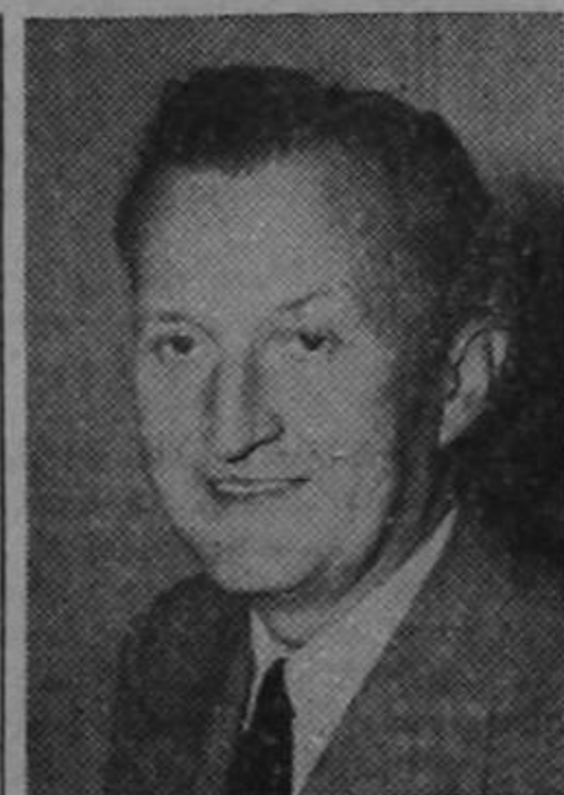
El señor Benton

Como parte de los esfuerzos realizados por la Secretaría de Estado para fomentar la libertad de información, según afirmó el señor Benton, los funcionarios están explorando las posibilidades de un plan de negociaciones bilaterales con otros países. Estas negociaciones tendrían por objeto eliminar las barreras económicas y políticas que obstruyen el intercambio de información, y estimular acatamiento al principio de libertad de información tanto dentro de los límites de cada país como en sus relaciones con los demás.