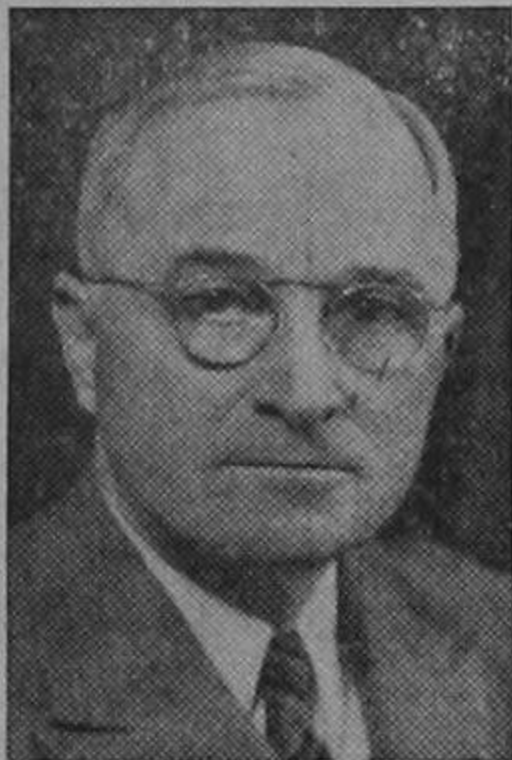
El Presidente Truman

WASHINGTON.—En su proclama oficial recomendando la celebración de la Semana Panamericana, a partir del día trece de abril, el Presidente Truman pone de relieve las aportaciones con que el Sistema Interamericano ha contribuido a la colaboración internacional.