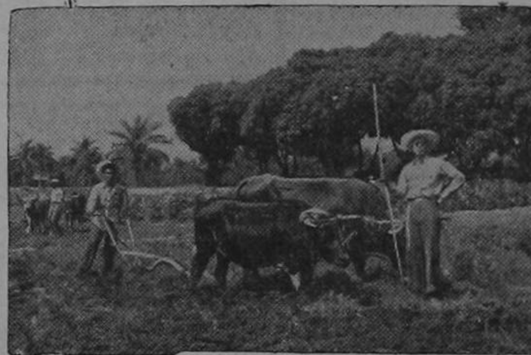
Tegucigalpa. — Preparación de la tierra por los alumnos, para el cultivo de hortalizas.