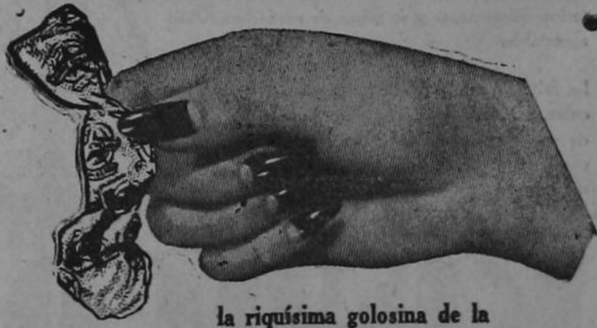
la riquísima golosina de la