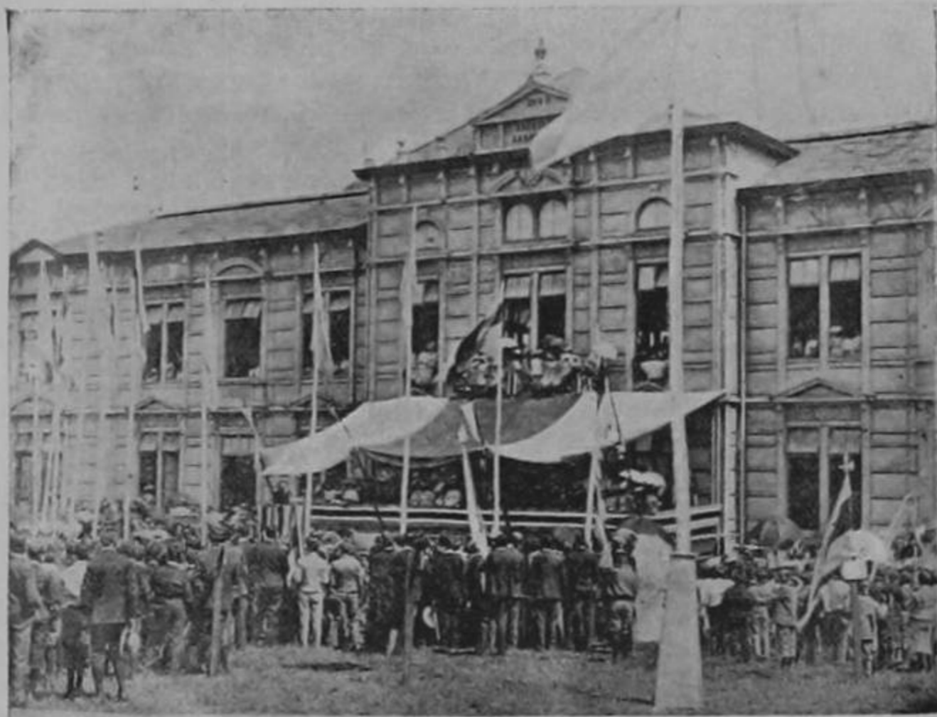
Vista del edificio de las Escuelas Graduadas de San José de Costa Rica

Persiguiendo CORREO DE ESPAÑA el fomento de las relaciones recíprocas entre Costa Rica y la Madre Patria, justo es tratar también de que se