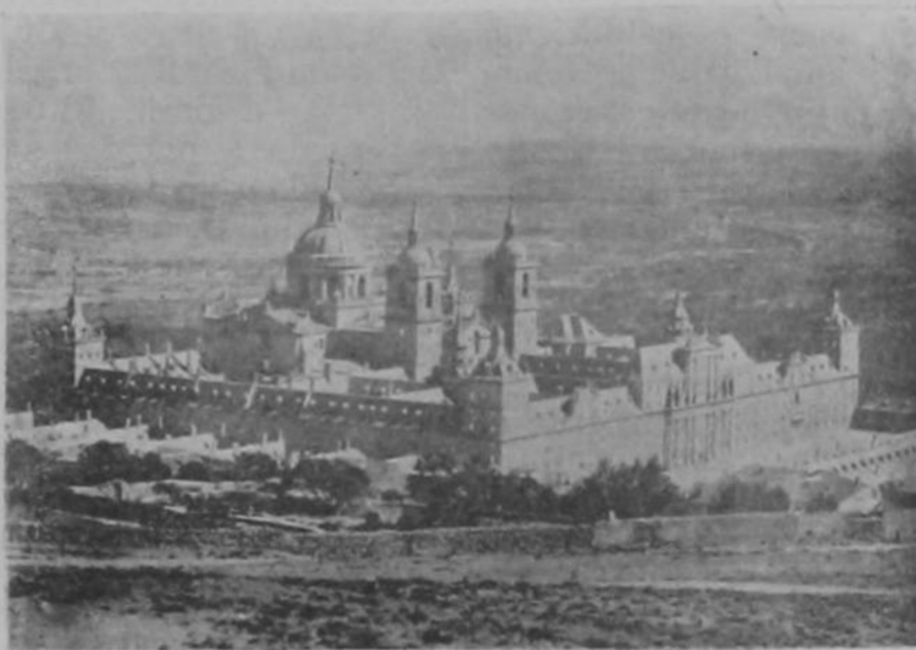
Real Monasterio de "El Escorial"

vimiento en las ciencias y en las artes. El siglo de Pericles, la Roma de Augusto, León X y su época, señalan grandes etapas en la marcha de la civilización. Entre ellas, con no menores títulos, debe de colocarse á la España del siglo XVI. Pasma y maravilla, estudiándolo de cerca, el número de hombres superiores que entonces florecieron y las grandiosas obras que supieron ejecutar.