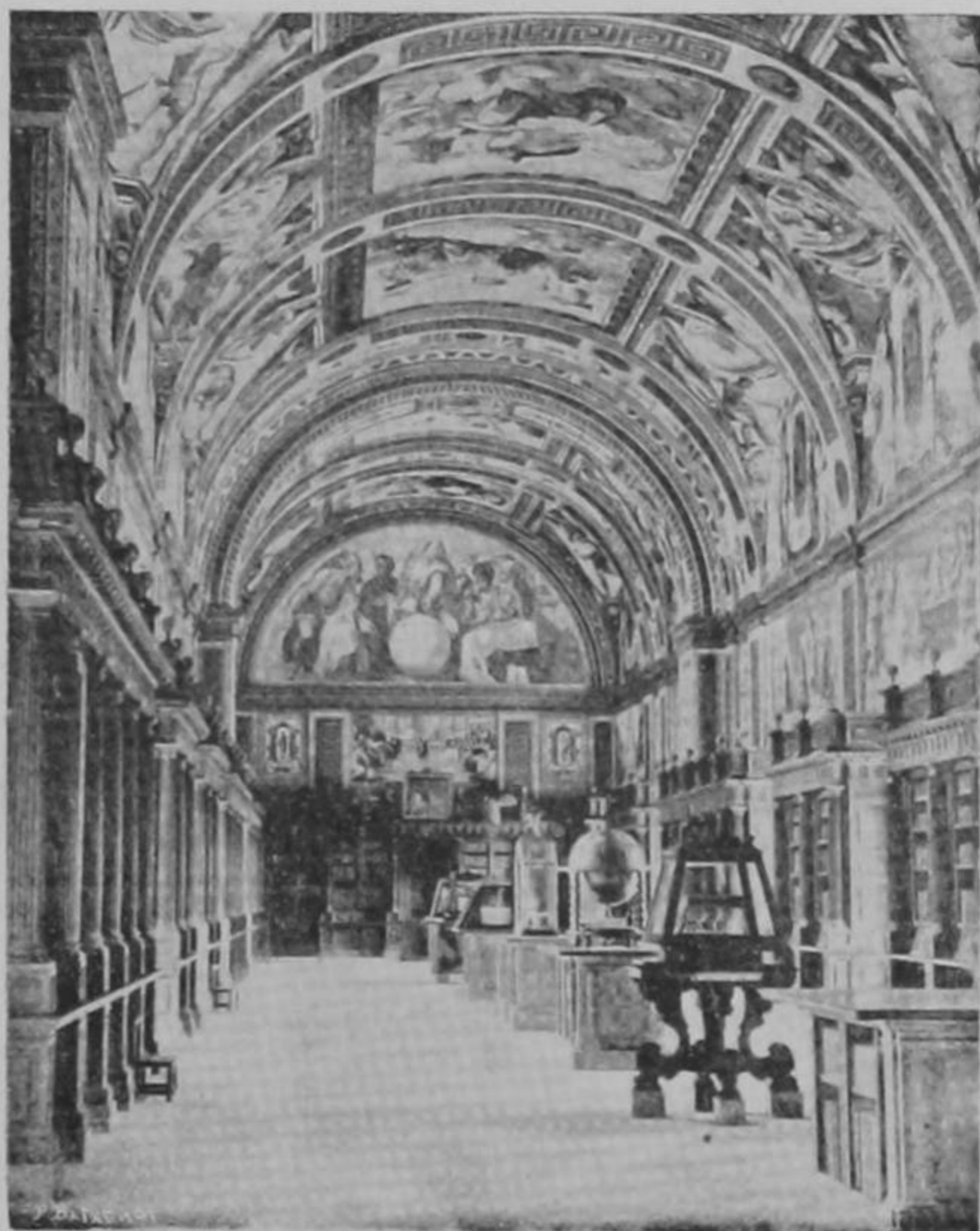
Biblioteca del Monasterio de "El Escorial"

La Biblioteca está dividida en tres partes, por dos arcos colocados sobre pilas tras resaltadas. Las bóvedas y testeros, así como los medallones y cornisas, fueron pintados al fresco por Tibaldi y Carducci, sobre asuntos simbólicos de ciencias y letras, alegorías, retratos de sabios ilustres, etc., siguiendo las indicaciones del P. Sigüenza. Sobre la puerta de entrada se halla representada «La Teología explicando á los Doctores de la Iglesia,» y en el medio punto, en frente de la puerta, «La Filo-