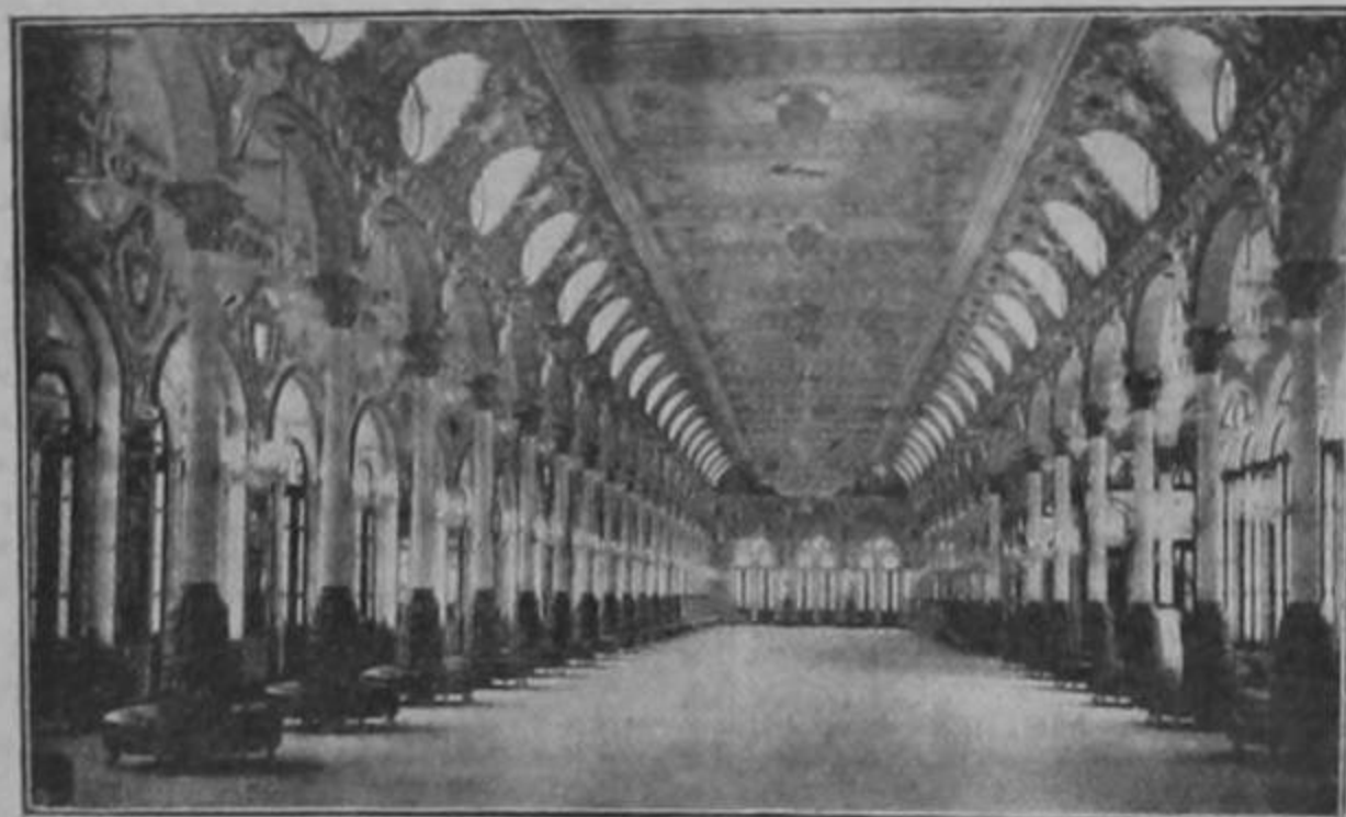
Salón de fiestas del Centro de Dependientes de la Habana