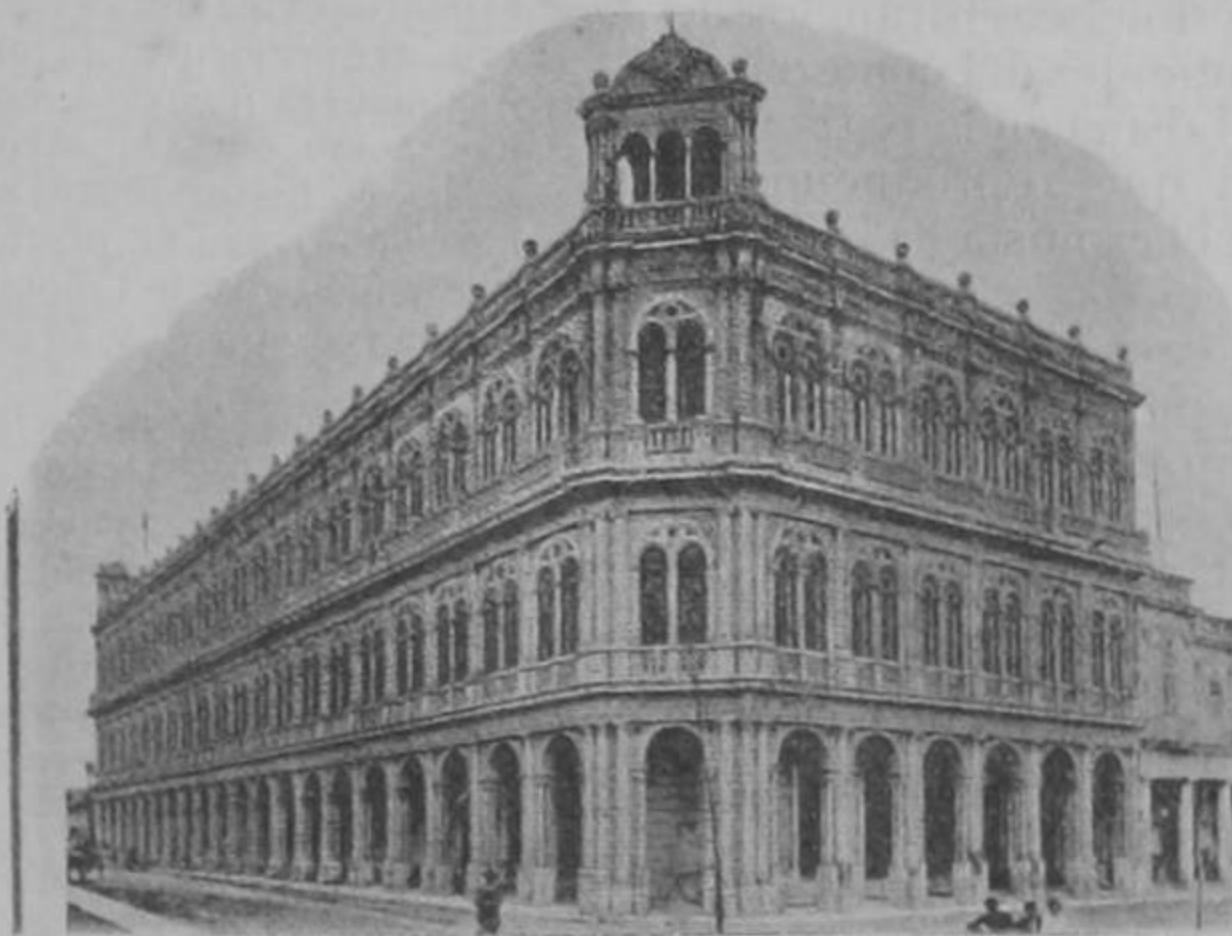
Edificio del Centro de Dependientes de la Habana

«La historia de los triunfos de la asociación—dice una memoria descriptiva que tenemos á la vista—está simbolizada por los edificios que su centro ha ocupado sucesivamente. A la casa Prado 85, de extensión insuficiente, sucedió en 8 de noviembre de 1885 la de San Rafael número 1 conocida por altos de Albisu; y resultando también ésta inadecuada para el número de socios y la importancia y brillo de la institución, el 1º de julio de 1902 se adquirieron, para fabricar un nuevo centro, las casas Prado 57, 59 y 61 y los solares de Morro 60, 62, 64 y 66 pagándose por ellos las sumas de 120.000 pesos oro español y 40.000 oro ame-